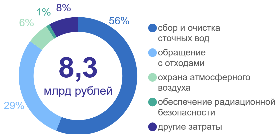
Текущие затраты на охрану окружающей среды по направлениям природоохранной деятельности в 2023 году